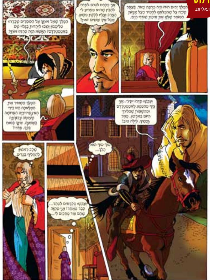
לרכישת ספר הקומיקס "דון קרלוס" בהדירות שופר, חייגו: 073-222-12-50 המשך בשבוע הבא...