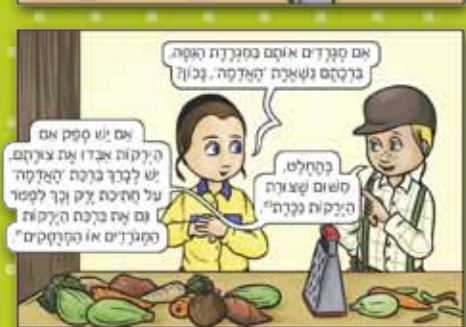
מתוך הספר "המברכים הצעירים", מאת ג'וניד