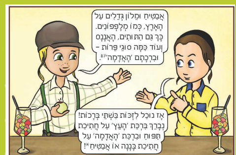
מתוך הספר "המברכים הצעירים", מאת גוינד