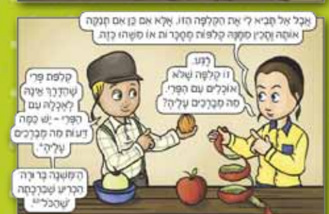
מתוך הספר "המברכים הצעירים", מאת ג.וינד