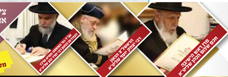
איך דוּ תַּשְׁמַח וְתִּשְׂמַח בְּיַד הַתְּבוּנָה הַבְּרִיָּה בִּי יוֹמֵי כַּף שֶׁלֵּא יִשְׁכַּח