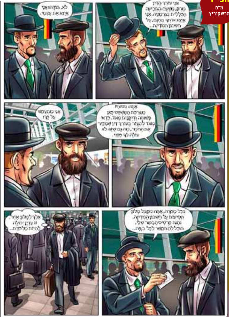
מגזין קונקסט | לרכישת 190 הקומיקס "הצייד" בהדברות שופו, חייגו: 073-222-12-50