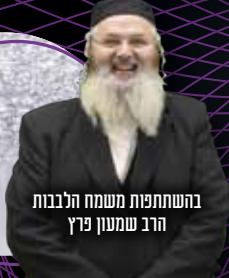
בהשתתפות משמח הלבבות הרב שמעון פרץ

השבת המרוממת במשך השנה כולה במלון המפואר המלך שלמה בירושלים