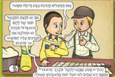
מתוך הספר "המברכים הצעירים", מאת גרינד