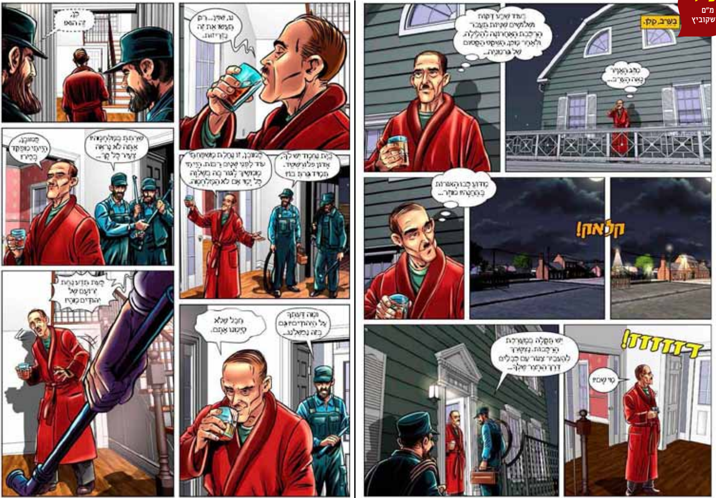
לרכישת 190 הקומיקס "הצייד" בהדברות שופו, חייגו: 073-222-12-50