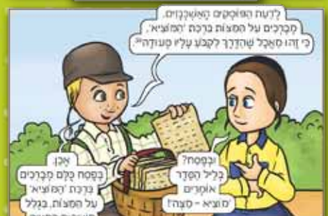
מתוך הספר "המברכים הצעירים", מאת גוינד