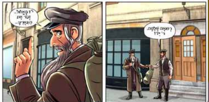
לרכישת 190 הקומיקס "הצייד" בהידברות שופר, חייגו: 073-222-12-50 המשך בשבוע הבא...