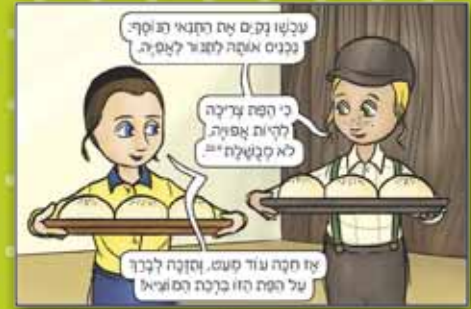
מתוך הספר "המברכים הצעירים", מאת גוינד