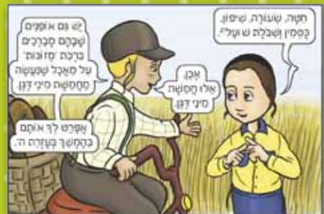
מתוך הספר "המברכים הצעירים", מאת גוינד